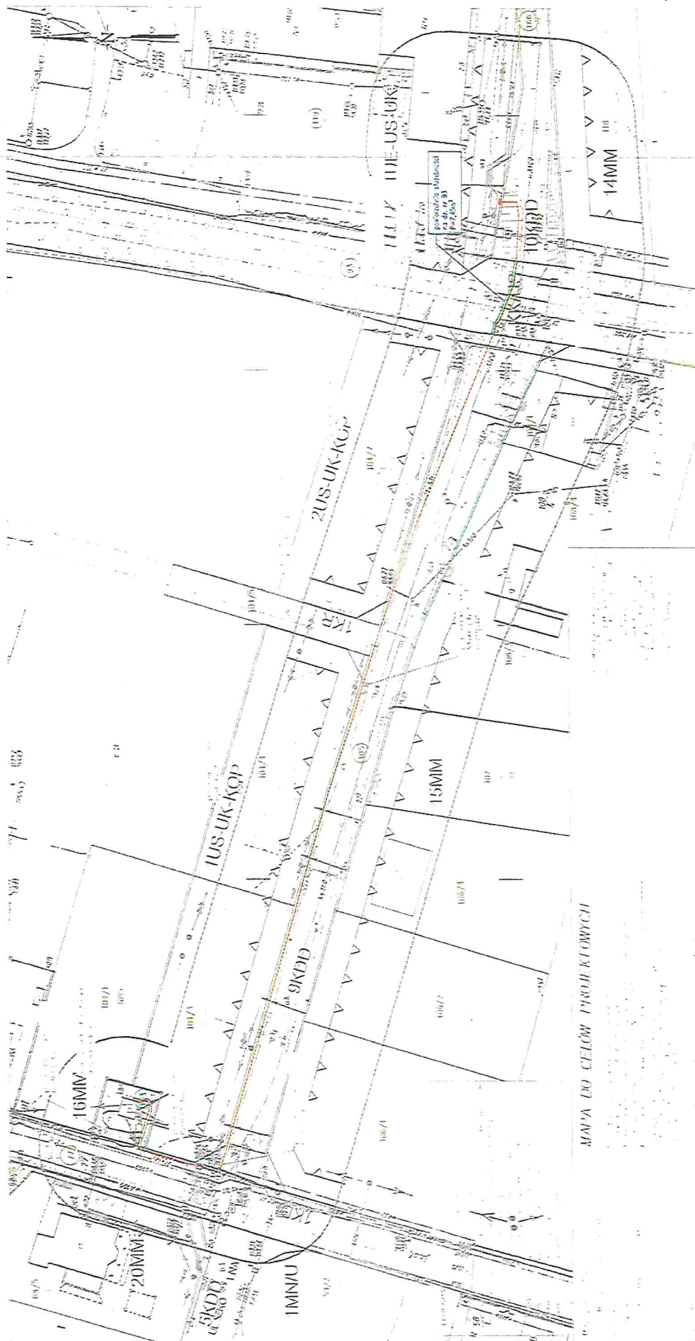
MAPA DO CELOW PROJEKTOWYCH